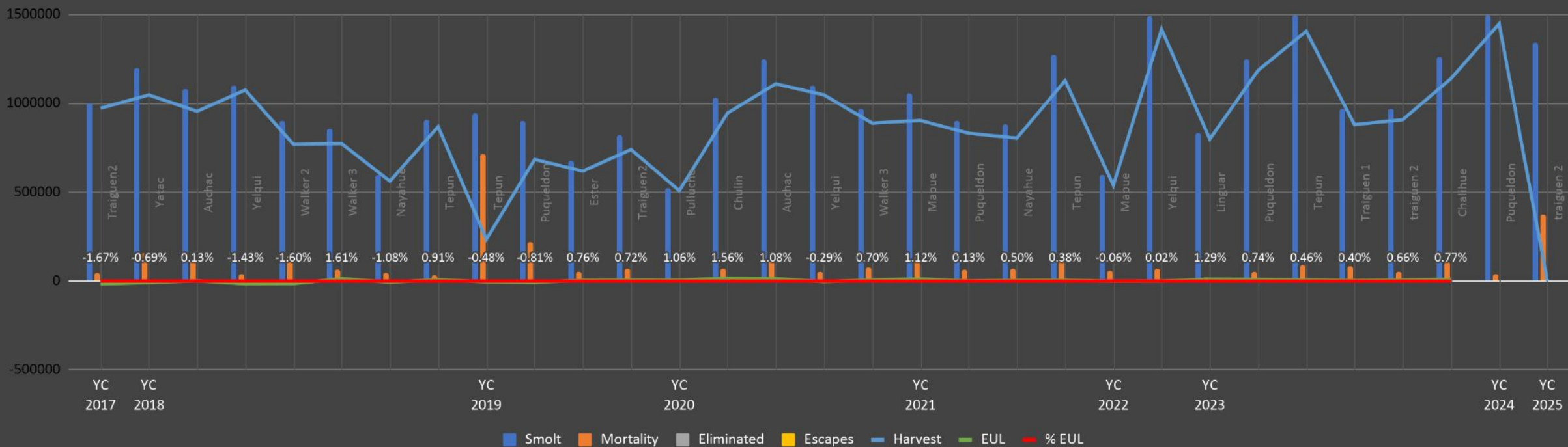
EUL (Perdidas Inexplicables) Centros ASC